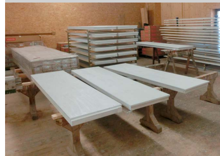
Vorschlag für gestrichene Ausführung vor Verlegung – grundiert und gestrichen

Linzmeier Bauelemente GmbH Industriestraße 21 88499 Riedlingen Tel.: +49 (0) 73 71 18 06-0