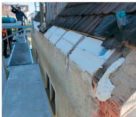
Traufe mit gekappten Sparren