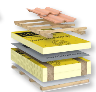
Altbausanierung oder Neubau LINITHERM PGV Flex Zwischen- sparrendämmung in Kombination mit LINITHERM Aufsparrendämmung für geringste Aufbauhöhen